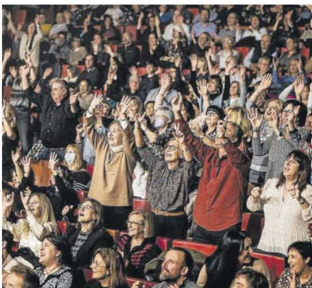
El público ha llenado los recintos del show.

Se trata del primer concierto y estreno mundial de los dos artistas, que actuarán mañana viernes, a partir de las 20 horas