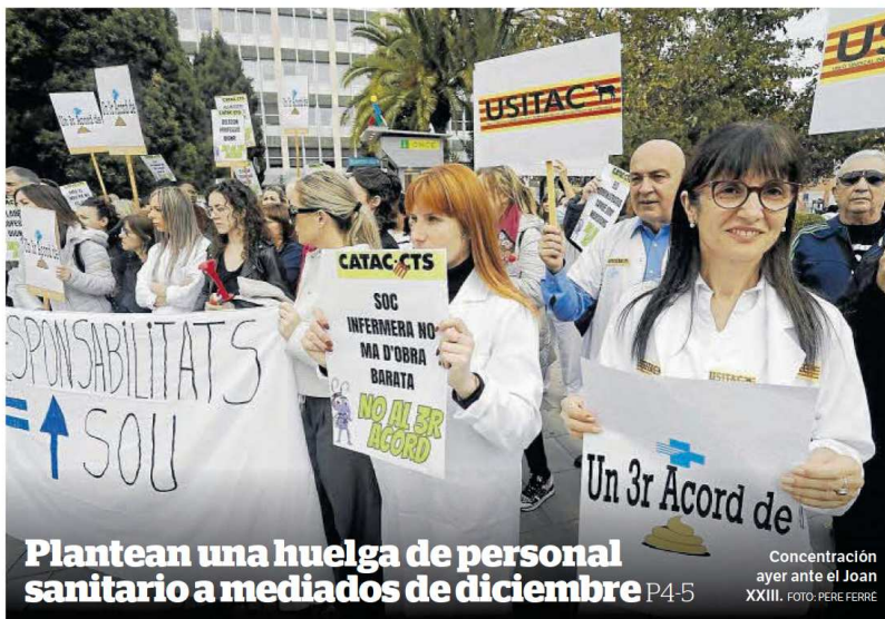
Plantean una huelga de personal sanitario a mediados de diciembre P4-5

Concentración ayer ante el Joan XXIII.